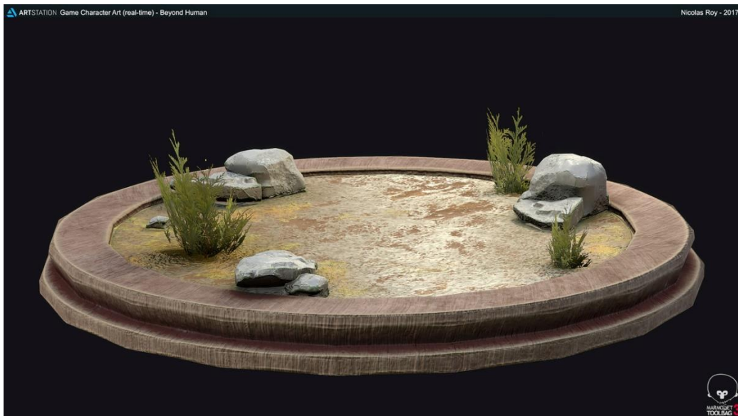
Diorama base example