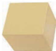
(b) Large dice: \frac{3}{4} in. \times \frac{3}{4} in. \times \frac{3}{4} in. (2 cm \times 2 cm \times 2 cm).